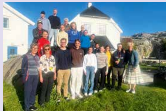
Så mange ungdommer og voksne som myser mot sola, trengs for å gjennomføre en fin konfirmantleir på Havlimt – pluss foreldre som kjører, hjelper til på kjøkkenet, er nattevakter og vasker oss ut.