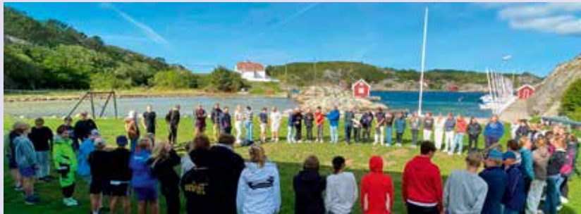
En stor flokk ungdommer opplevde fellesskap gjennom undervisning og fritid på Havlimt.