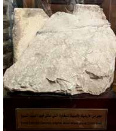
På denne steinen står det: Original stein fra den hula der Jesus Kristus levde.