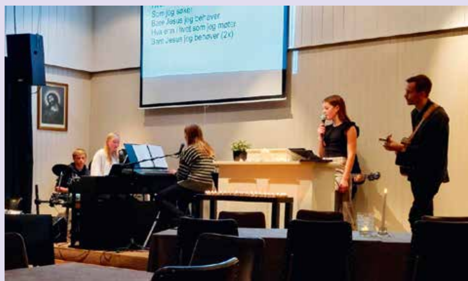
Under torsdagsgudstjeneste på Engesland bedehus deltok denne forsangergruppa.