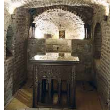
I denne hula under kirka fra 300-tallet, skal Jesus, Maria og Josef ha oppholdt seg.