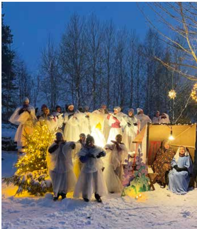
Julevandringa på Tobias jorde kan gi fine opplevelser.

Det hele dreier seg om at menigheten skal kunne fortsette det trosopplæringsarbeidet som er så godt i gang. Da beskjeden kom om at inntektene måtte økes for at ikke arbeidet måtte reduseres, svarte altså dere givere. Det er både rørende og godt å registrere. En varm takk til alle givere!