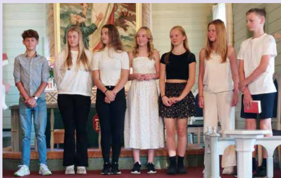
Årets konfirmanter blir presentert i Vegusdal kyrkje.