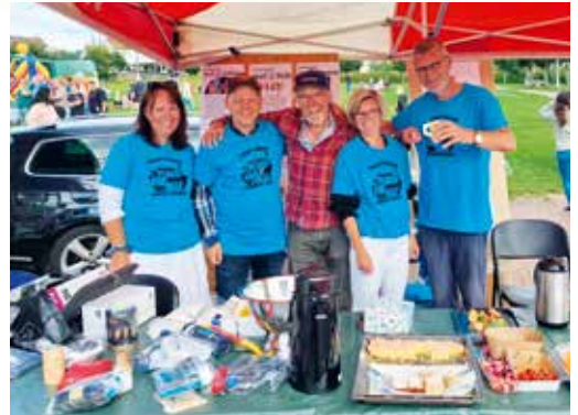
Glad gjeng