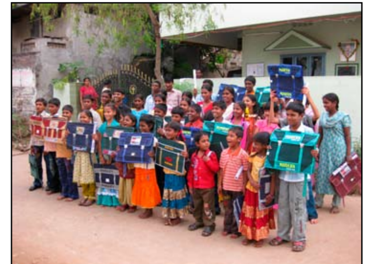
Barnehjemsbarn i Ubalanka med nye ransler

For meg ble det likevel spesielt å få åpne den nye brønnen i landsbyen Kattunga, spesielt fordi pengene til brønnen kom fra barn på Birkeland skole. De hadde tjent pengene, og de hadde tjent så mye at det ble nok til 200 nye ransler, et EKG-apparat til hospitalet i Lolla og 2 sykler til barna på barnehjemmet, i tillegg til brønnen. En journalist fra lokalavisen ville ha oss med til å sette fokus på bedre hygiene og ville at vi i tillegg til å åpne brønnen, skulle feie gata. Det gjorde vi under stor jubel. Mottoet hans var: "Først reint vann, så reine landsbyer!"