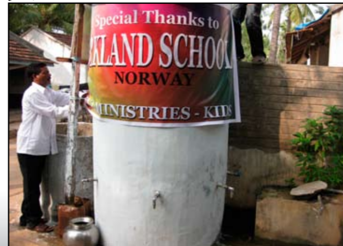
Den nye brønnen i Kattunga gitt av elever på Birkeland